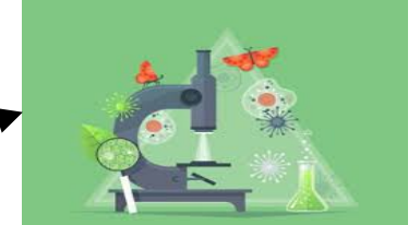
SCIENCES DE LA VIE ET DE LA TERRE