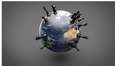
HISTOIRE GÉOGRAPHIE, GÉOPOLITIQUE, SCIENCES POLITIQUES