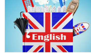
LANGUES, LITTÉRATURE et CULTURE ÉTRANGÈRE ANGLAIS