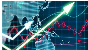
SCIENCES ÉCONOMIQUES ET SOCIALES