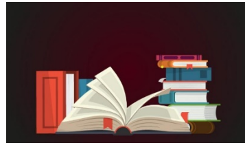
HUMANITÉ, LITTÉRATURE, PHILOSOPHIE